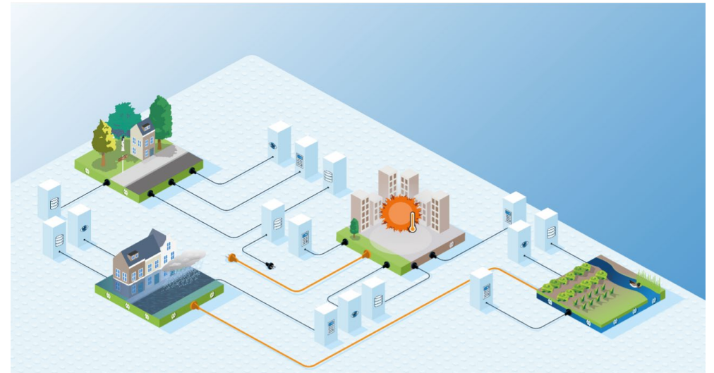
Bouwen aan een digitale infrastructuur op basis van interoperabiliteit.

Binnen het European Digital Infrastructure Consortium nLDT CitiVERSE (EDIC nLDT) bouwen lidstaten gezamenlijk aan publieke, digitale infrastructuren. Capaciteitsopbouw op EU-niveau is daarbij cruciaal. Interoperabele platforms op basis van open standaarden vormen daarin het fundament voor een duurzame digitale transformatie voor ambtelijke gebiedsprofessionals. Binnen die context staat Europa voor een grote kans om op Europees niveau de publiek-private samenwerking binnen en tussen lidstaten verder te versterken richting een toekomstbestendig Europees digitale infrastructuur.