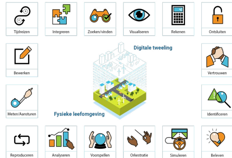
Functionele kaart van beleidsmogelijkheden voor digitale tweelingen.