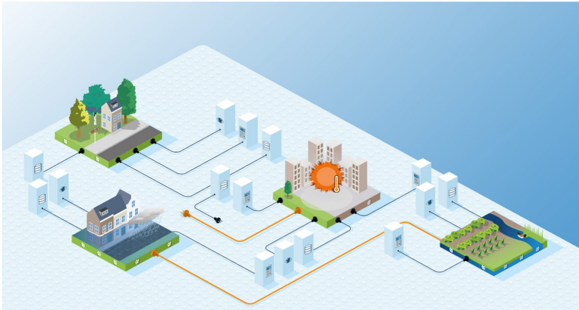
Building a digital infrastructure based on interoperability.