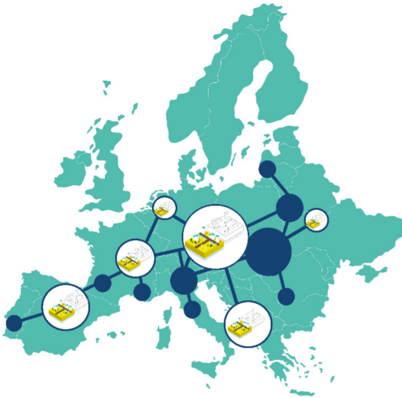
Collaboration on digital twins in Europe.